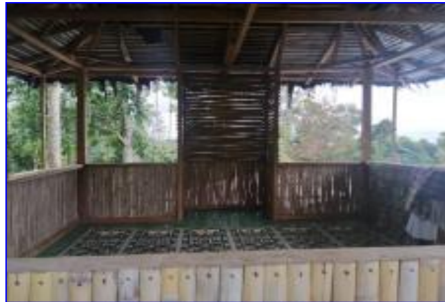
Gambar 9. Mushola di objek wisata Kayu Kolek

Tempat ibadah merupakan salah satu kebutuhan pokok umat beragama yang tengah berwisata. Sehingga hal ini menjadi satu paket yang harus disediakan pengelola objek wisata. Meski tentatif, keberadaan mushola dalam tempat wisata sangatlah penting, apalagi jika lokasi objek wisata tersebut jauh dari pemukiman penduduk. Di dalam lokasi objek wisata “Kayu Kolek”, saat ini terdapat 1 buah mushola yang cukup representatif dengan kondisi toilet cukup bagus dan air yang sangat bersih.