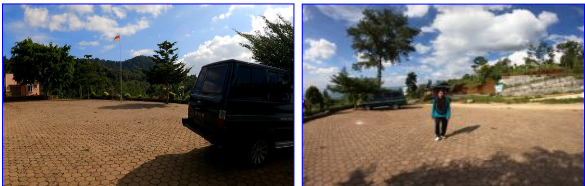
Gambar 14. Area parkir objek wisata Kayu Kolek

Ketersediaan lahan parkir yang memadai merupakan salah satu faktor yang menentukan tingkat kunjungan wisatawan. Bertambahnya jumlah pengunjung suatu objek wisata berpengaruh terhadap volume parkir. Saat ini pada lokasi objek wisata “Kayu Kolek” terdapat area parkir dalam kondisi yang cukup layak dan sudah dilapisi paving block. Selain itu juga terdapat lahan berupa ruang terbuka yang diperuntukkan sebagai lahan parkir cadangan jika jumlah pengunjung membludak.