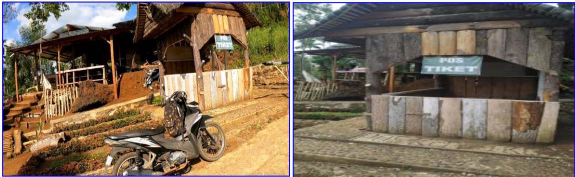
Gambar 11. Pos pelayanan tiket objek wisata Kayu Kolek

Berdasarkan hasil observasi, pengamatan dan wawancara dengan pengelola, saat ini terdapat 1 unit pos tempat pembelian tiket masuk pada objek wisata “Kayu Kolek”. Pos berukuran 2.5mx2,5m terbuat dari kayu dengan lantai yang sudah dicor semen. Harga tiket masuk yang ditetapkan adalah Rp 5.000,-/orang.