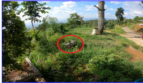
Gambar 16. Tumpukan sampah di objek wisata Kayu Kolek

Hasil identifikasi pada pelaksanaan penelitian ini menunjukkan bahwa di lokasi objek wisata “Kayu Kolek” masih belum memiliki tempat-tempat pembuangan sampah, sehingga para pengunjung membuang sampah di beberapa titik lokasi di dalam objek wisata tersebut, seperti ke jurang yang letaknya tidak begitu jauh dari lokasi objek wisata itu, sampah-sampah plastik juga terlihat bertebaran dimana-mana.