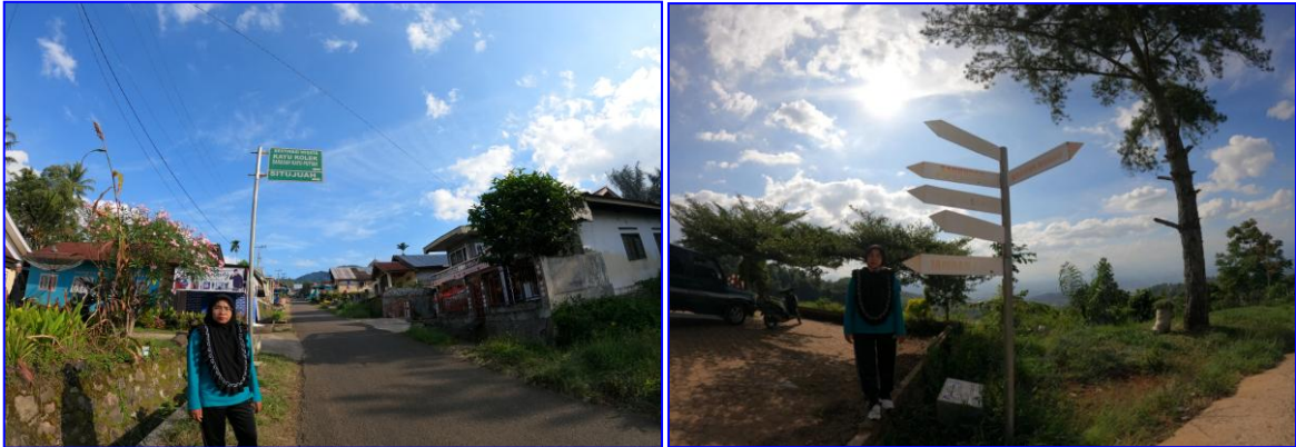
Gambar 12. Pos kemandirian objek wisata Kayu Kolek

dengan papan penunjuk arah yang menunjukkan arah bermacam spot menarik yang bisa dikunjungi wisatawan saat berada di lokasi objek wisata “Kayu Kolek”.