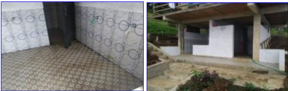
Gambar. Toilet umum di objek wisata Kayu Kolek

Berdasarkan hasil penelitian, kondisi saat ini sudah ada 2 unit toilet umum di objek wisata “Kayu Kolek”, kondisinya cukup dan layak dengan air yang sangat bersih. Hal yang sama juga terlihat pada toilet yang terdapat pada mushola di dalam lokasi objek wisata ini. Lantai toilet juga sudah dilapisi keramik.