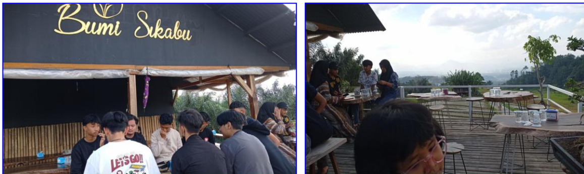
Gambar 10. Cafe Bumi Sikabu di Objek Wisata “Kayu Kolek”

Salah satu komponen yang perlu diperhatikan dalam kepariwisataan adalah tersedianya restoran (rumah makan) yang memadai bagi wisatawan. Saat ini di sekitar lokasi objek wisata “Kayu Kolek” terdapat setidaknya 3 buah warung yang menyediakan kebutuhan makanan dan minuman bagi para pengunjung di lokasi objek wisata ini. Tidak jauh dari lokasi objek wisata “Kayu Kolek” juga terdapat 1 buah cafe yang bernama Bumi Sikabu. Kafe ini cukup viral di media sosial.