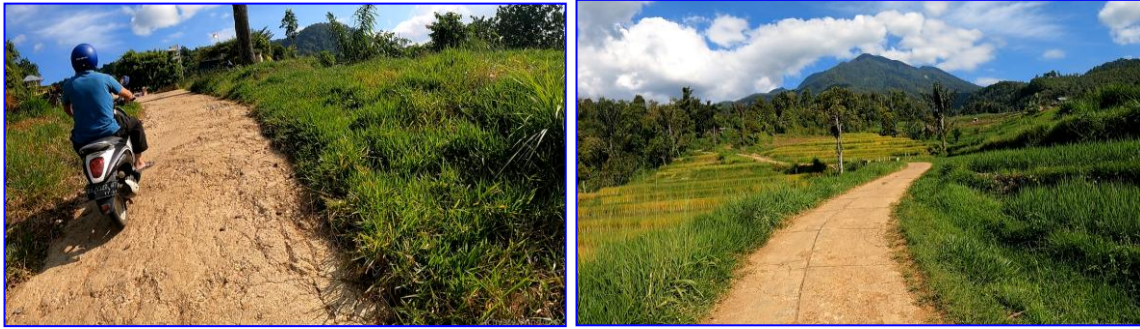
Gambar 15. Aksesibilitas jalan menuju objek wisata Kayu Kolek