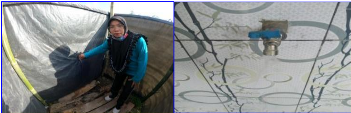
Gambar 7. Ketersediaan air bersih di Kayu Kolek

Ketersediaan air bersih pada objek wisata “Kayu Kolek” sudah sangat baik, karena objek wisata ini terletak di kaki gunung Sago, sehingga air bersih dapat dengan mudah didapatkan. Saat ini terdapat satu buah embung yang dibangun oleh pihak pengelola yaitu pemerintah nagari SITAPA. Air pada embung itu berasal dari air gunung Sago. Air inilah yang sehari-hari digunakan untuk kebutuhan masyarakat sekitarnya.