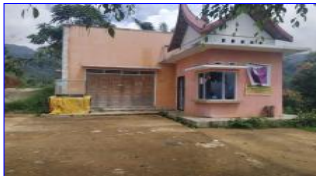
Gambar 12. Pos kemanan objek wisata Kayu Kolek

Pos keamanan dan informasi pariwisata merupakan fasilitas pendukung yang membantu pengunjung objek wisata untuk mendapatkan informasi mengenai destinasi yang mereka kunjungi. Saat ini pada objek wisata “Kayu Kolek” terdapat 1 unit pos keamanan dan informasi. Pos keamanan dan informasi ini berupa bangunan permanen yang dibangun di dalam lokasi objek wisata tersebut.